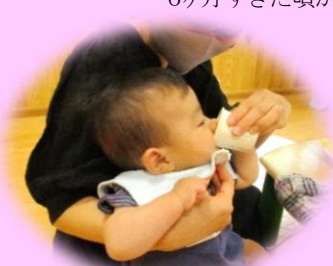
「コップ飲み」 6ヶ月すぎた頃から