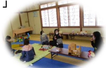
集落センターでの活動の様子